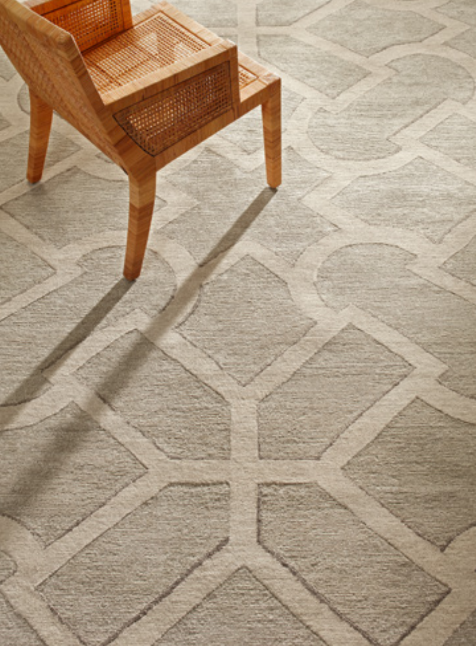
Loches Laine, lin & soie / Wool, Linen & Silk