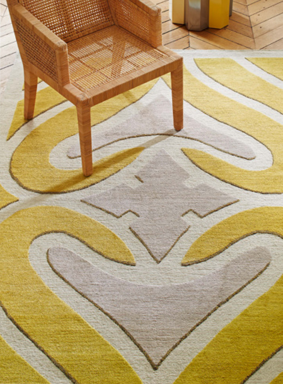
Villandry Laine, lin & soie / Wool, Linen & Silk