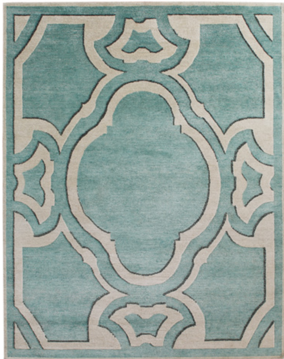
Chenonceaux Laine, lin & soie / Wool, Linen & Silk