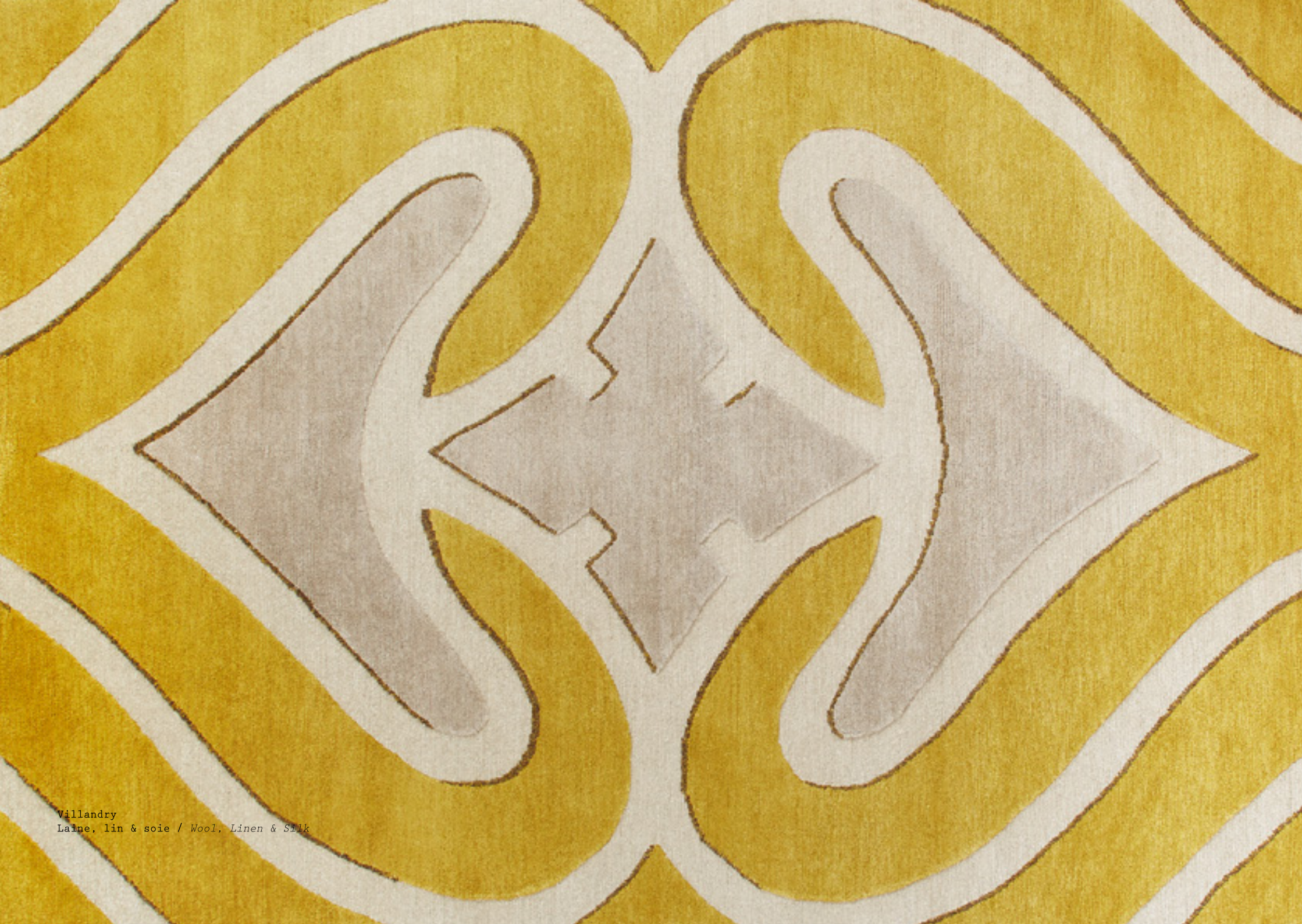
Villandry Laine, lin & soie / Wool, Linen & Silk