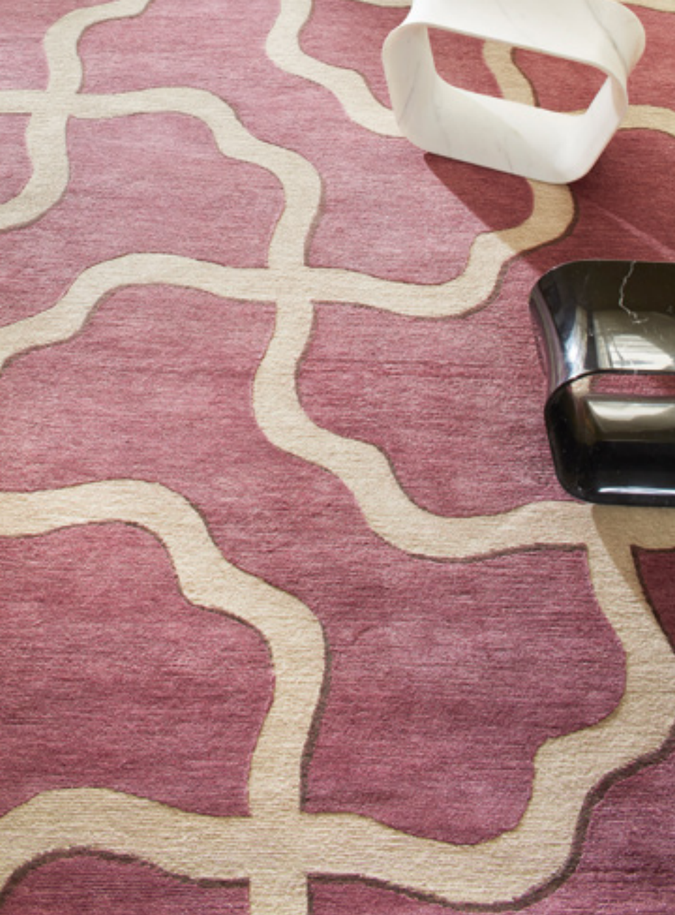
Angers Laine, lin & soie / Wool, Linen & Silk