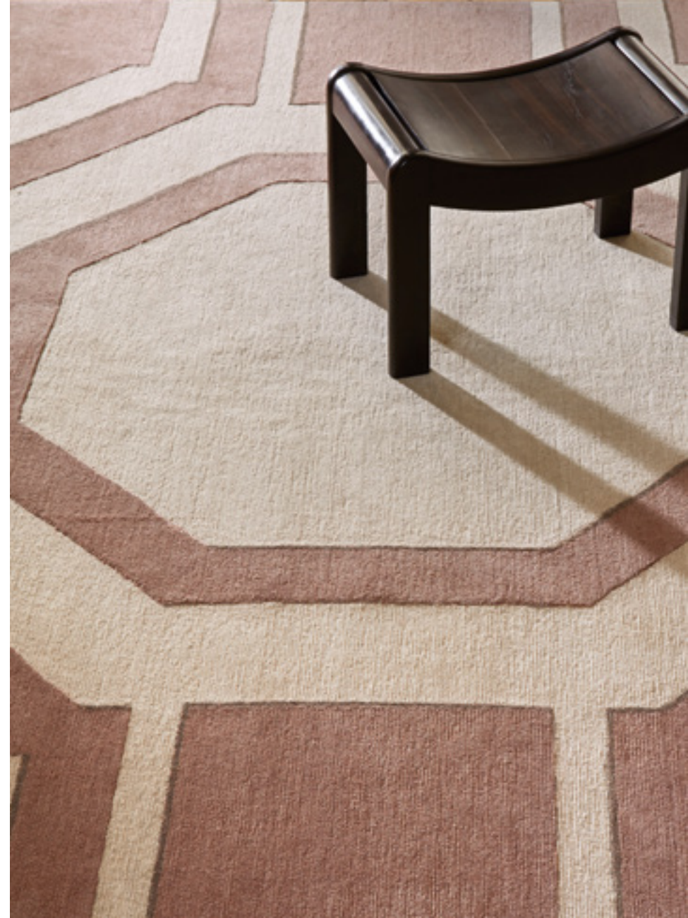
Azay Laine, lin & soie / Wool, Linen & Silk