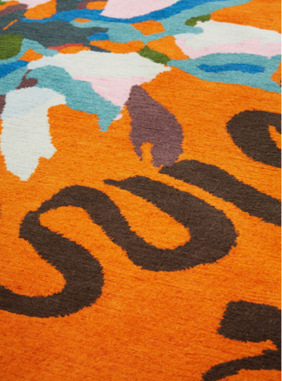
Éloge Laine / Wool