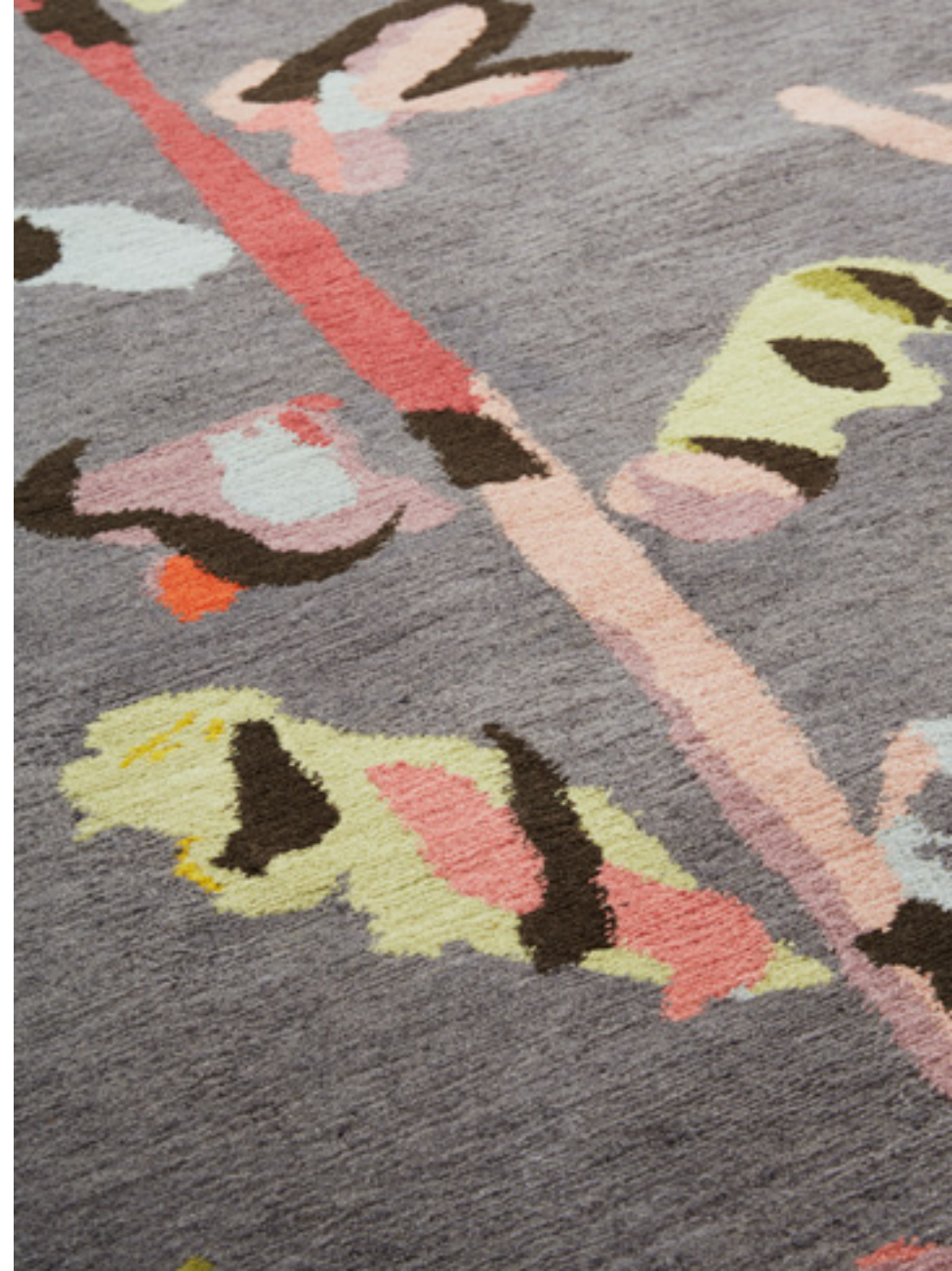
Euphonie Laine / Wool