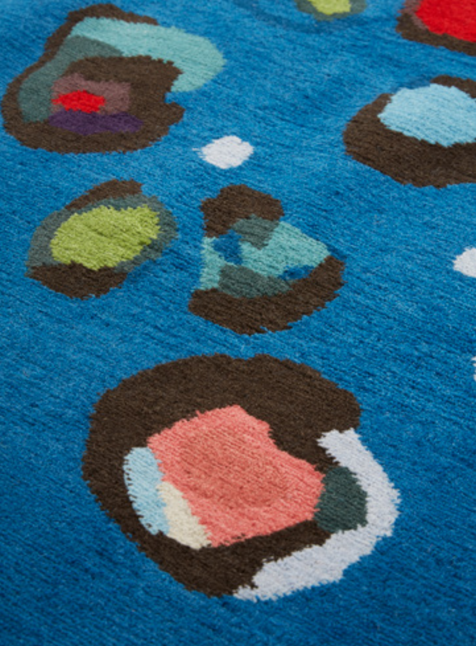
Songe Laine / Wool