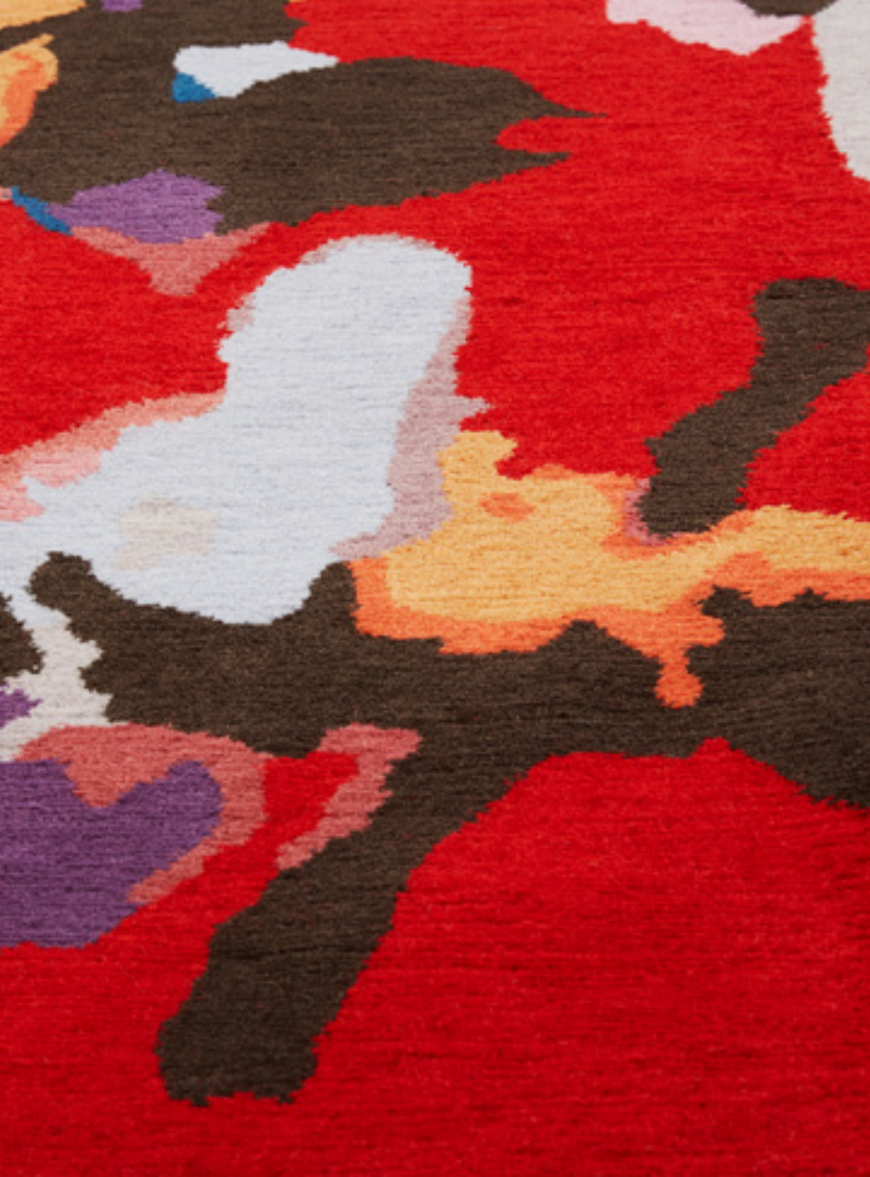
Agapé Laine / Wool