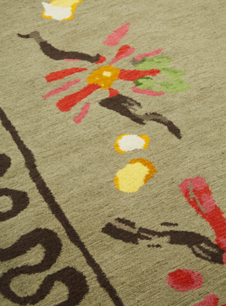
Éclat Laine / Wool