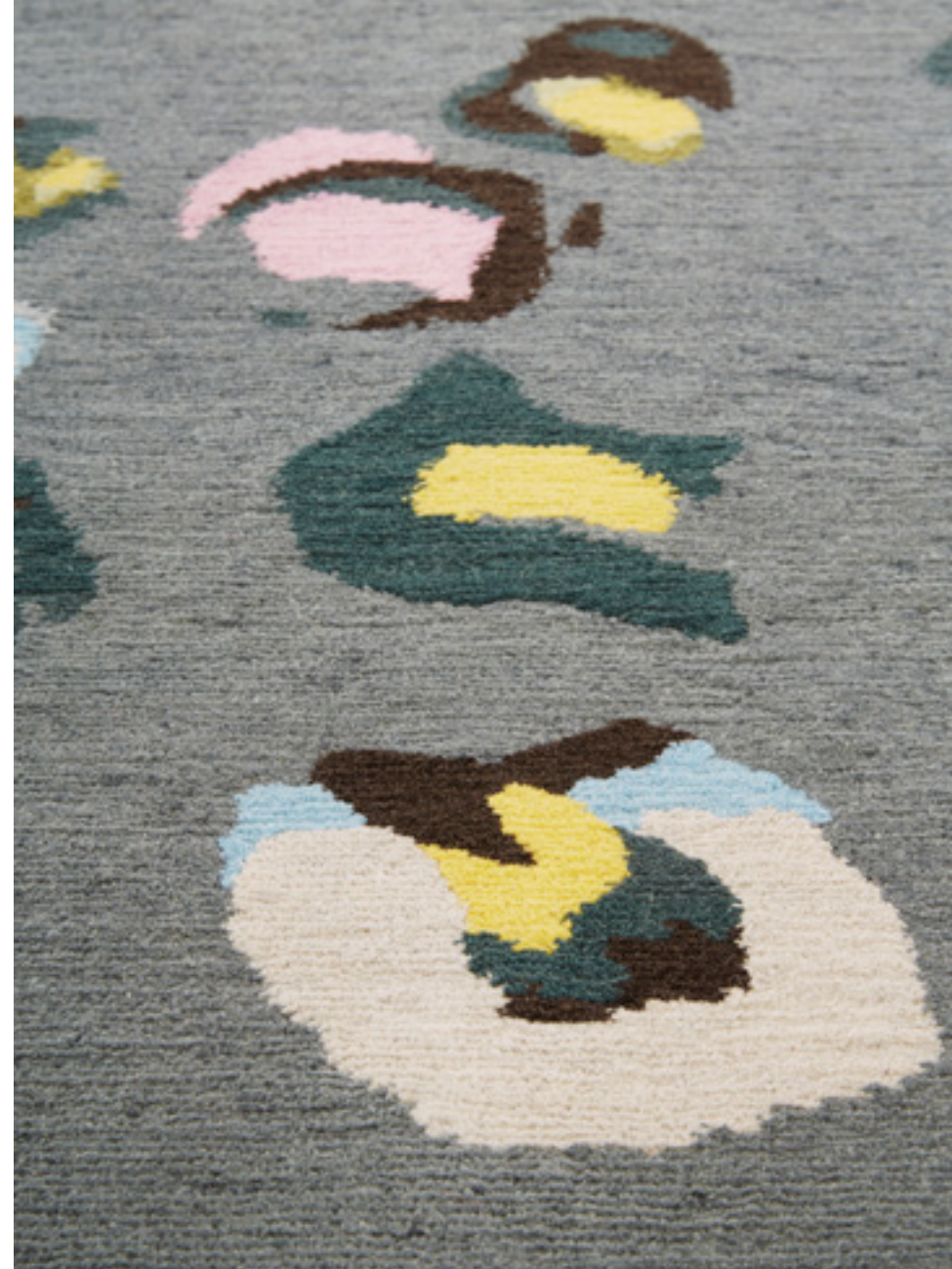
Dilection Laine / Wool