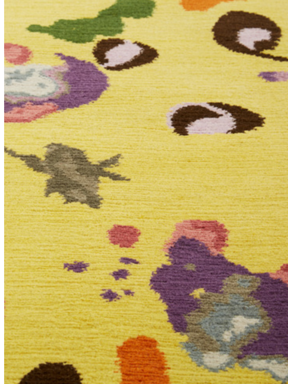
Philia Laine / Wool