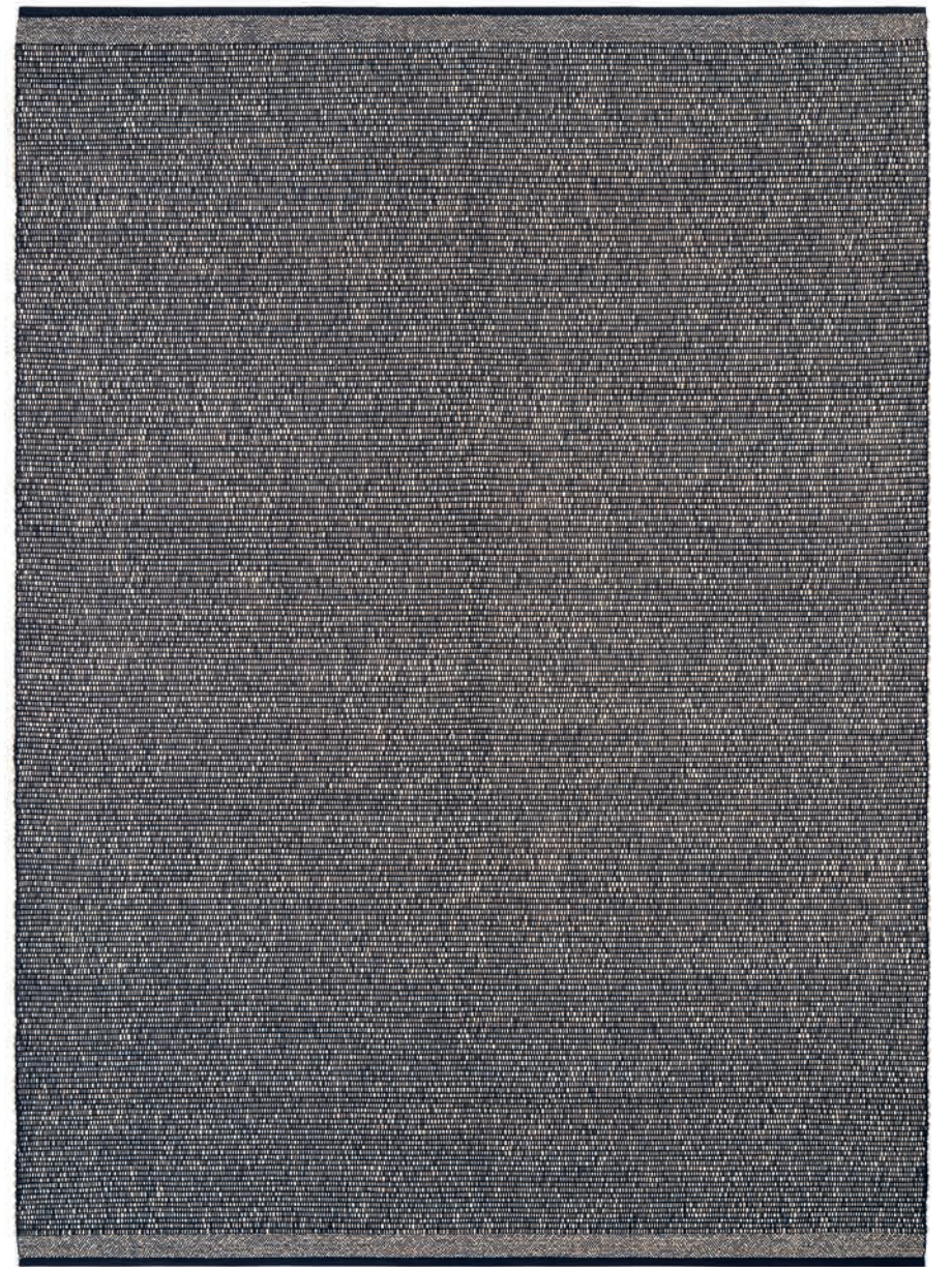
Bruit Endurance & Raphia / Endurance & Raffia