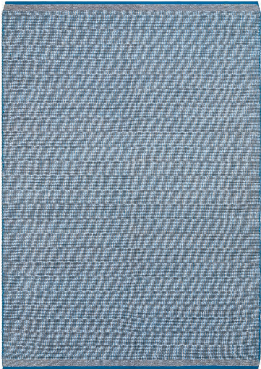
Signal Endurance & Raphia / Endurance & Raffia